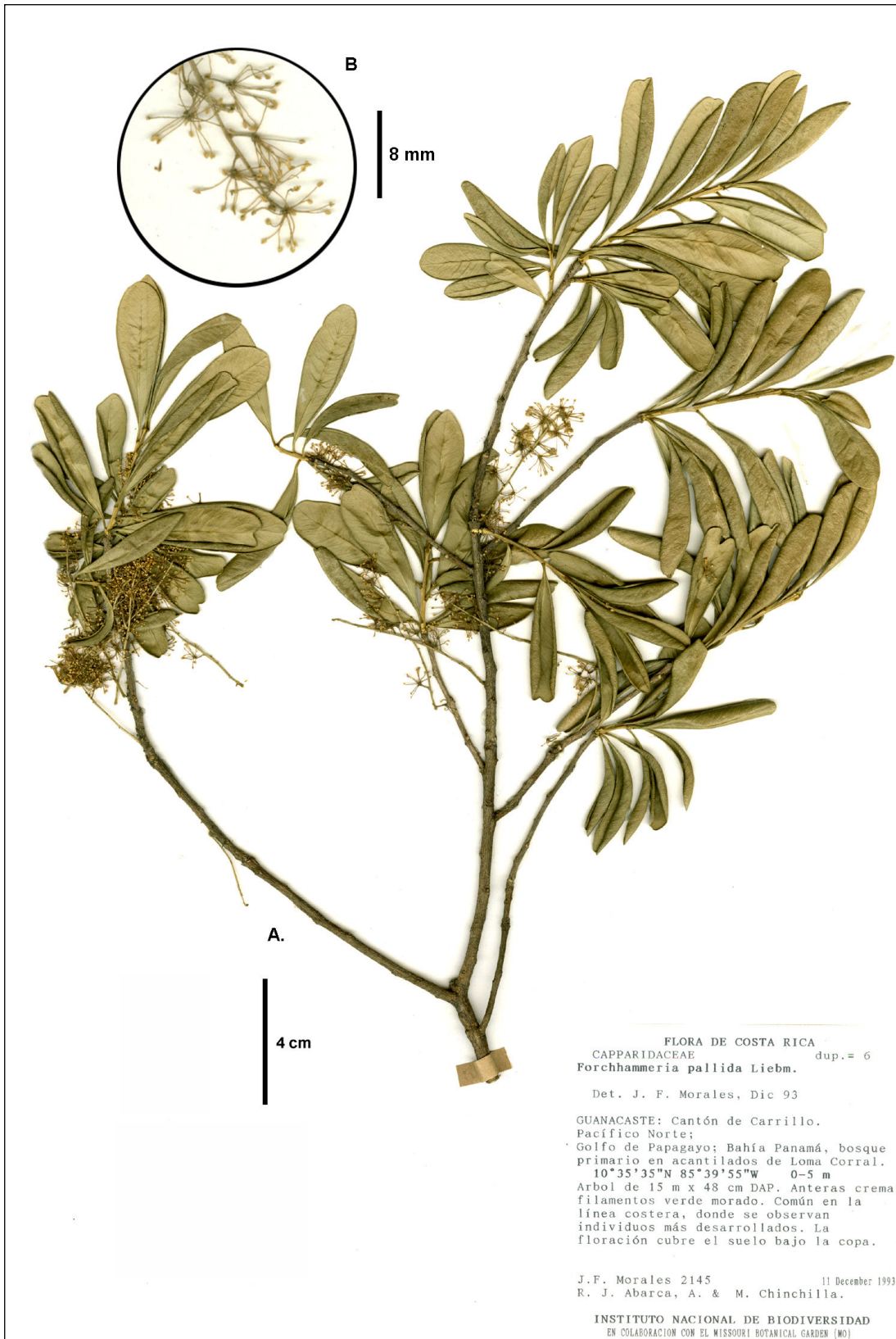
Figure 1. Forchhammeria iltisii (holótipo). A. Rama con inflorescências masculinas. B. Detalle de las flores masculinas.