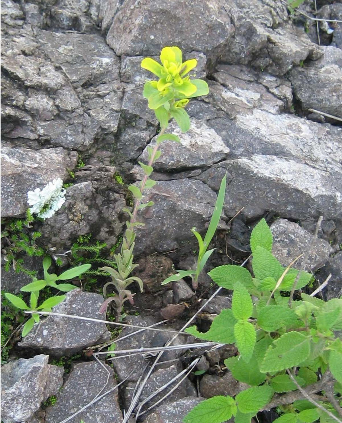
Figura 2. Castilleja madrigalii .

anchamente oblanceoladas, la pubescencia del tallo, las hendiduras más grandes del cáliz, las hojas y la densidad de flores en la inflorescencia. En la tabla 1 se enlistan algunas de las características diferenciales entre estas tres especies.